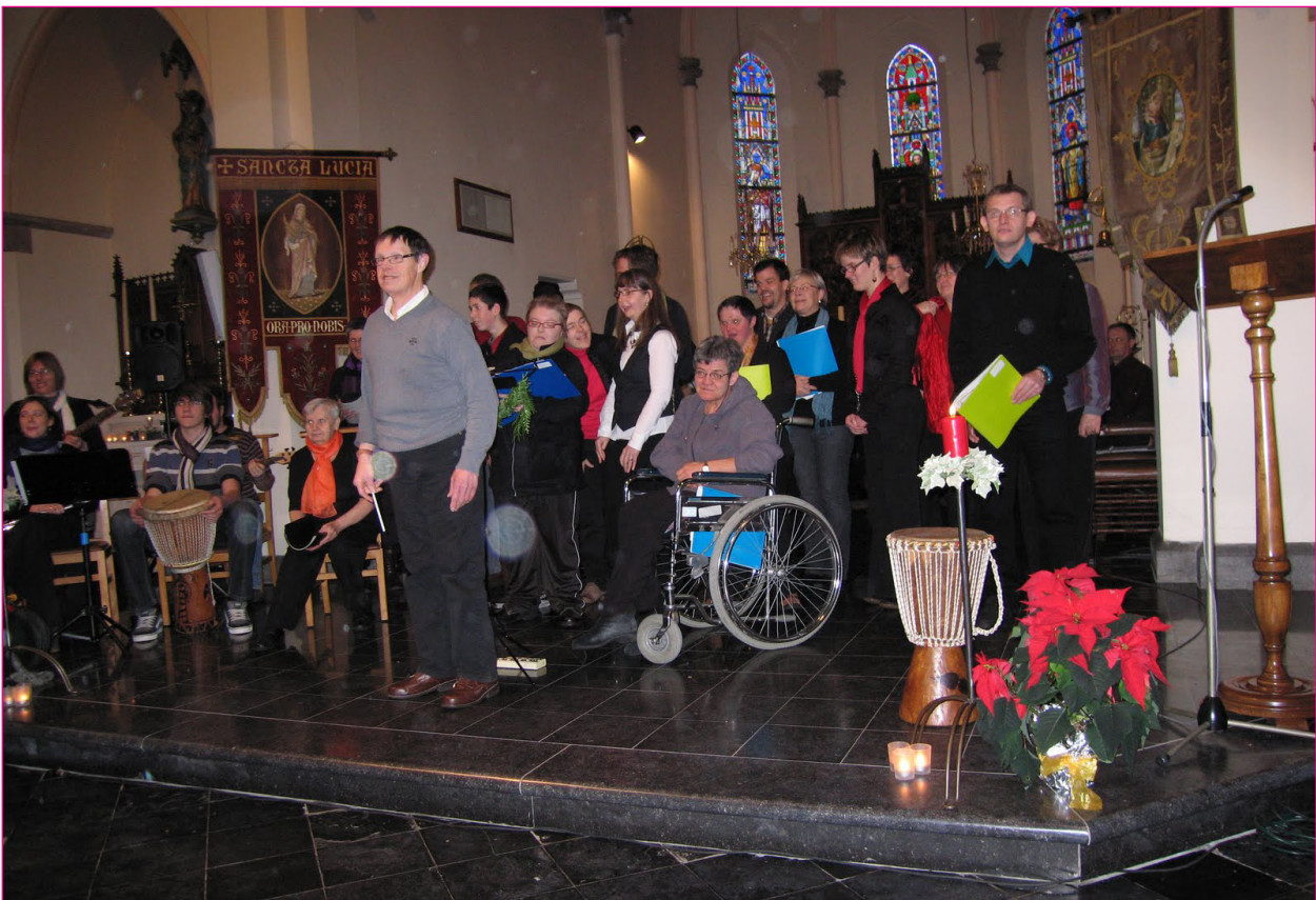
Zingende vrijwilligers in het koor 'Gelijkgestemd'